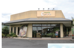
◀「とみかわや」 (写真は杉山店)